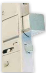
STEP 29 Silent™ kan ta utskjutande fallkolvar på upp till 20 mm.