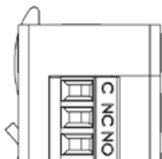
Inkoppling sker med skruvplint. Skyddsdiode finns inbyggd.