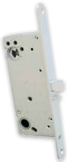
Dörrlåset ska vara enligt skandinavisk standard, beroende på montagestolpe med enkelfall eller dubbelfall.